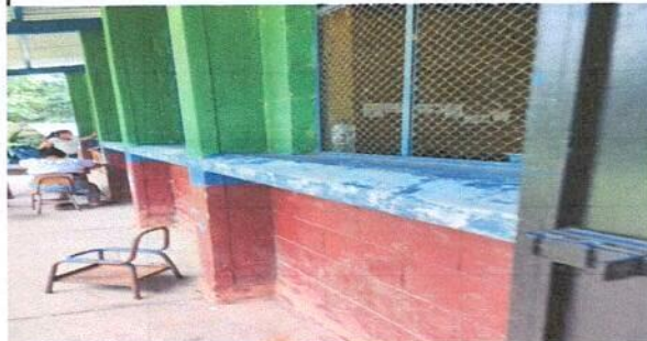
Foto 4: imagen enfente del establecimiento, ya se ve muy deteriorado la pintura.