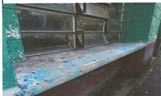
Foto 5: imagen de de las ventanas deterioradas y la pintura muy mal estado.