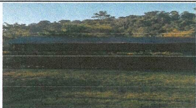
Foto1: Sustitucion de lámina, por lamina troquelada aluzinc calibre 26