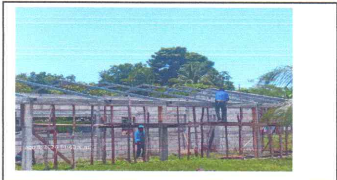
Foto 3: Sustitucion de vigas