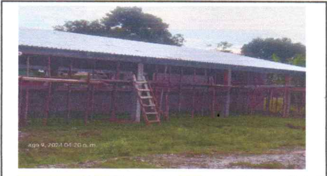
Foto2: sustitución de Láminas