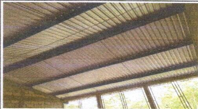
Foto 3: Mantenimiento de Estructura de metal del centro educativo público