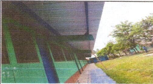
Foto 1 Sustrucción de lámina, por lámina troquelada del centro educativo público.