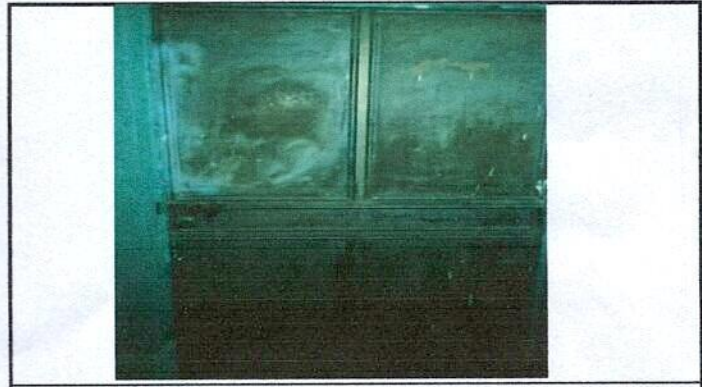
Foto 4: Puerta de metal muy antigua, ya no funciona la chapa, esta deteriorada por oxido y quebrada en la parte inferior.