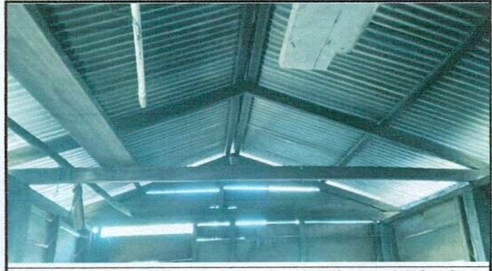
Foto 2: vista interna de la cocina, estructura de techo muy deteriorado.