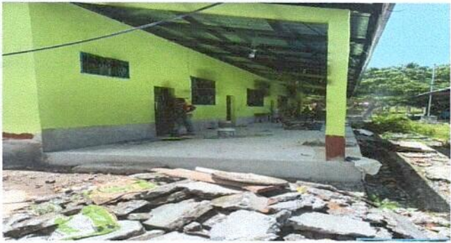
Foto1: Sustitución de puertas de madera por metal