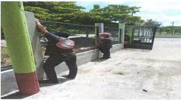
Foto 3: Reparación de muro perimetral del centro educativo público