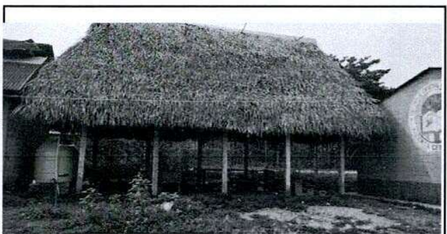
Foto 6: VISTA DE LA COCINA DONDE SE NECESITA PISO EN LA PARTE INTERNA

Observación: Si es necesario se pueden agregar hojas adicionales y actualizar el número de hojas.