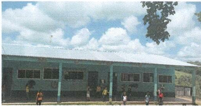
Foto1: sustitucion de laminas por laminas troqueladas aluzinc calibre 26 del estableciemiento educativo.