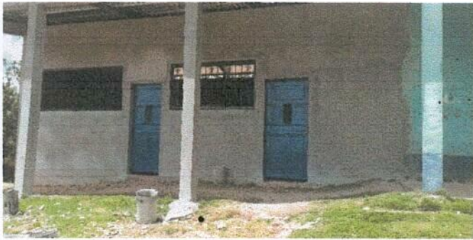
Foto 3: colocación de 2 puertas de metal de la nueva consrucción del establecimineto educativo