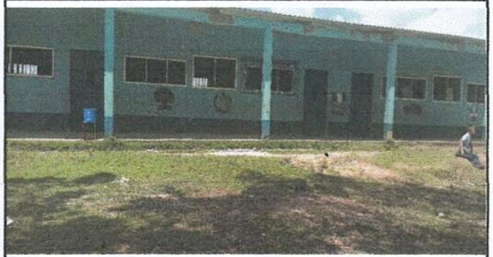
Foto 2: sustitucion 3 puertas de madera a metal del estableciemiento educativo.