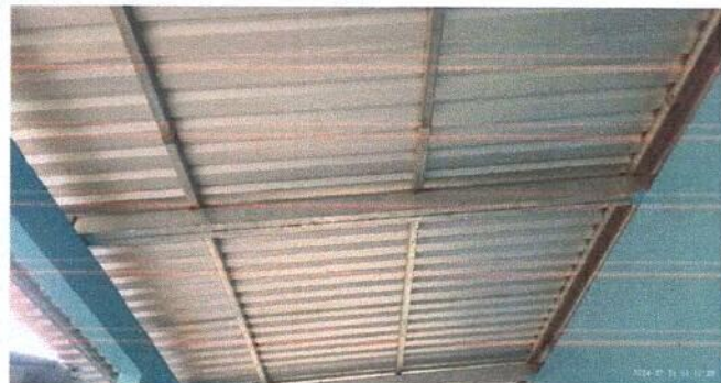
Foto1: ya estan instaladas las estructuras de metal y laminas troqueladas