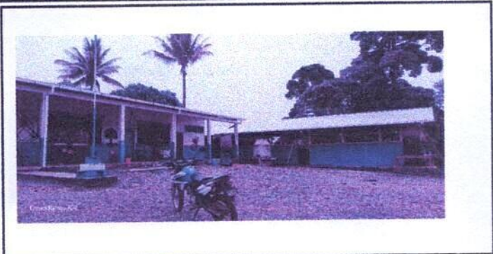
Foto1: Sustitucion de lamina