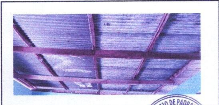
Foto 5: Sustitucion de estructura de soporte de maderera por metal