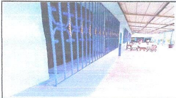
Foto1: vista general del establecimiento