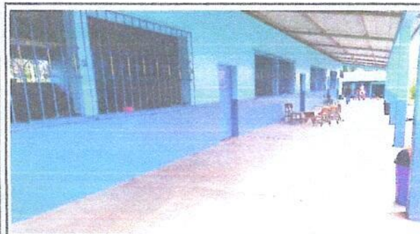
Foto 3: vista general de la pintura del establecimiento educativo.