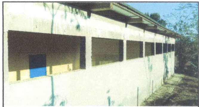
Foto 4: Instalacion de balcones de metal para el Edificio Escolar