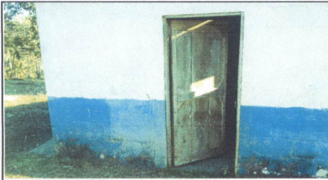
Foto1: Instalacion de puerta de metal de la cocina