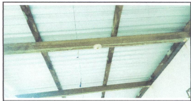
Foto 6: Sustitucion de focos ahorradores para el Edificio Escolar

Observación: Si es necesario se pueden agregar hojas adicionales y actualizar el número de hojas.