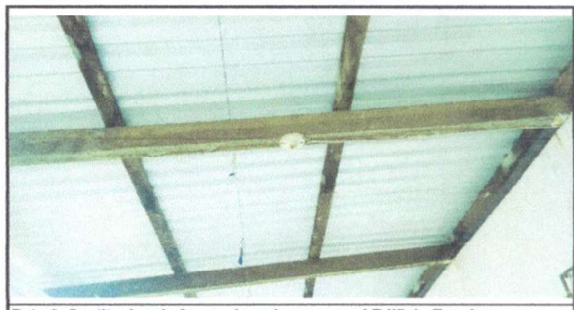
Foto 6: Sustitucion de focos ahorradores para el Edificio Escolar

Observación: Si es necesario se pueden agregar hojas adicionales y actualizar el número de hojas.