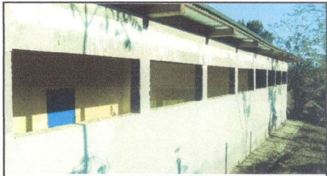
Foto 4: Instalacion de balcones de metal para el Edificio Escolar