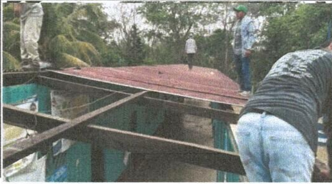
Sustitución de lámina, por lámina troquelada del edificio escolar