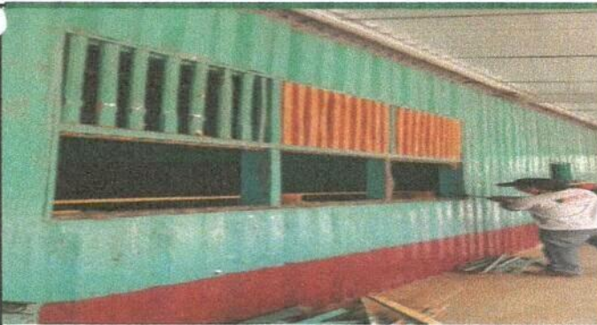
Sustitución de balcones de madera, por metal, de frente