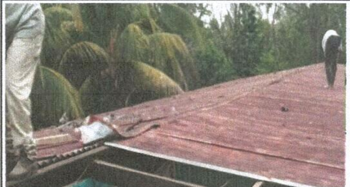
Sustitución de capote de lámina, para lámina troquelada