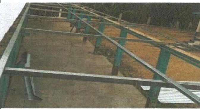
Sustitución de estructura de madera, por metal