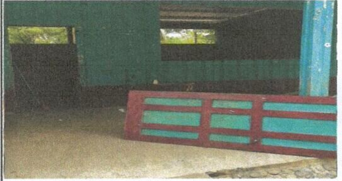
Sustitución de puerta de madera, por metal