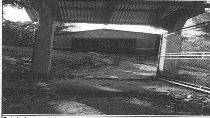
Foto1: Imagen de la entrada del establecimiento