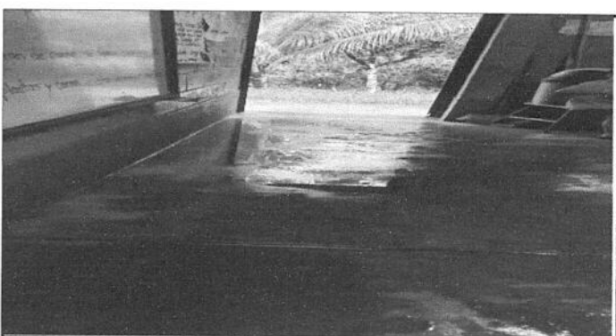
Foto 6: Por las láminas rotas entra el agua de lluvia al interior de las aulas.

Observación: Si es necesario se pueden agregar hojas adicionales y actualizar el número de hojas.