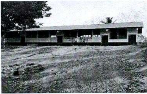
Foto1: VISTA GENERAL DEL ESTABLECIMIENTO.