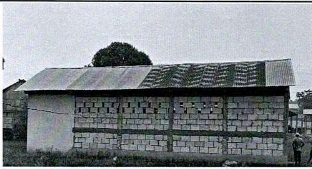
Foto 1: VISTA DE LA LÁMINA EN MAL ESTADO DEL MÓDULO DE PREPRIMARIA