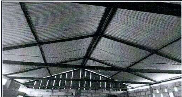
Foto 2: ESTRUCTURA DE SOPORTE DE MADERA DEL TECHO, EN MAL ESTADO DEL MÓDULO DE PREPRIMARIA