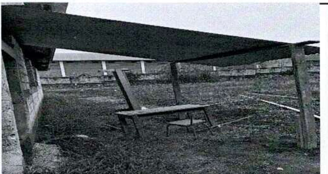
Foto 5: CORREDOR IMPROVIZADO, PARA EVITAR QUE LOS RAYOS DE SOL ENTREN DIRECTAMENTE AL MÓDULO DE PREPRIMARIA.