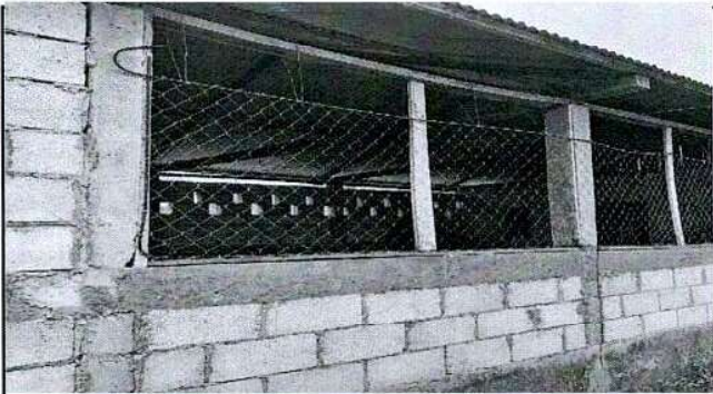
Foto 3: BALCONES IMPROVIZADOS QUE SE HAN COLOCADO PARA EVITAR EL INGRESO DE PERSONAS AL MÓDULO DE PREPRIMARIA.