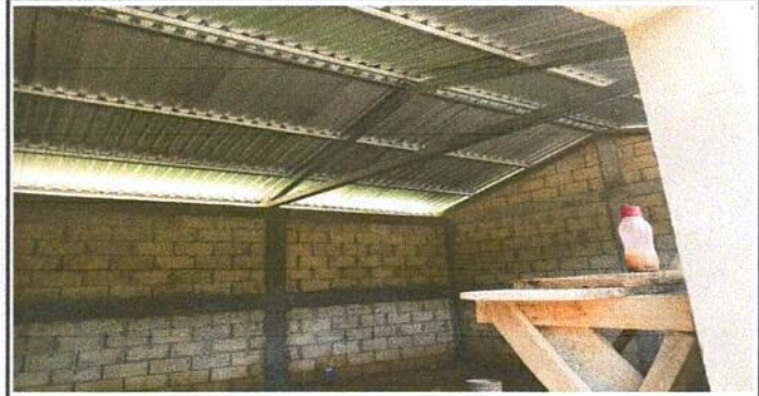
Foto 2: Sustitución de estructura de madera por metal del centro educativo.