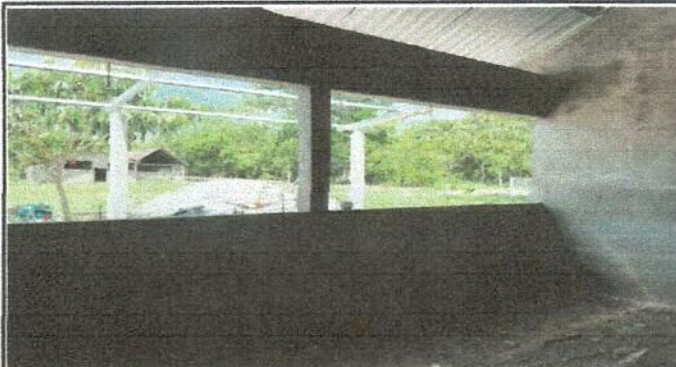
Foto 3: Instalación de balcones para ventana del centro educativo