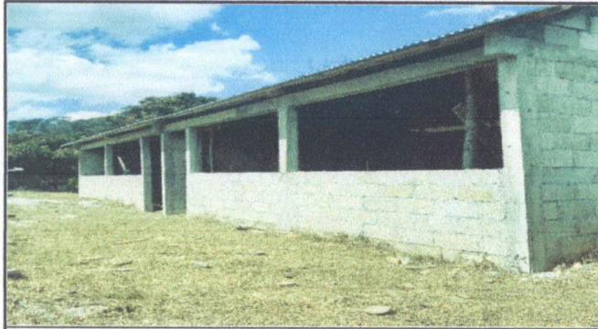
Foto1: Sustitución de lámina, por lámina troquelada aluzinc calibre 26