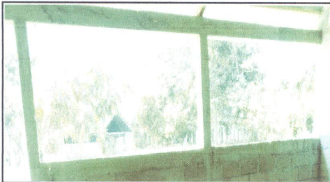
Foto 3: Instalación de balcones para ventana del centro educativo