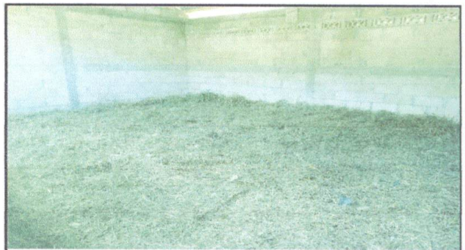
Foto 4: Sustitución de piso de torta de concreto del centro educativo