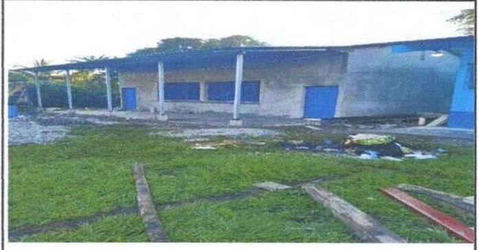
Foto 2: Techado general por laminas troqueladas y parte de estructuras metalicas.