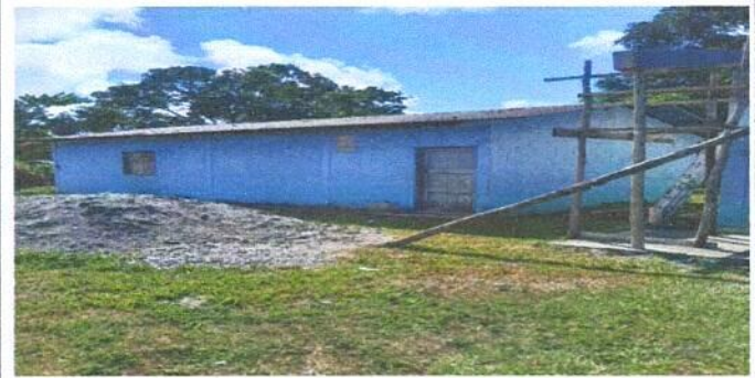
Foto 2: Techado general por laminas troqueladas y parte de estructuras metalicas.