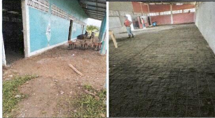
Foto1: SUSTITUCION DE PISO DE TORTA DE CEMENTO