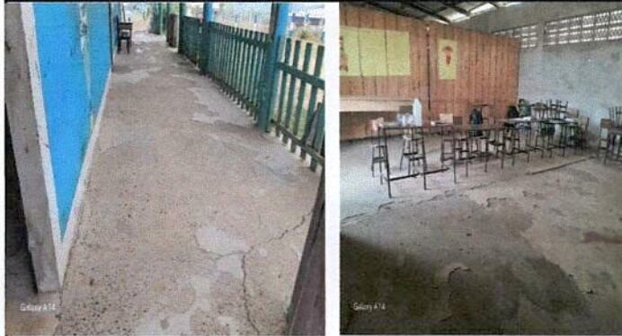
Foto1: Vista de la parte externa del centro educativo y el aula mas dañada