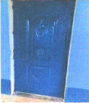
Foto1: Sustitucion de Puerta