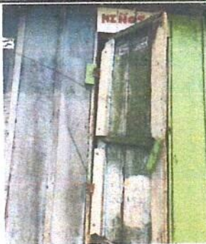
Foto 5: estado de los sanitarios para uso de niños y niñas escolarizados.