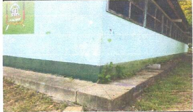
Foto 2: colocacion de 9 valcones en la parte de atrás de cada aula.