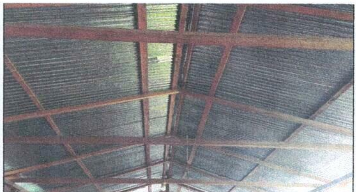
Foto 4: Sustitución de estructura de soporte de madera, por metal