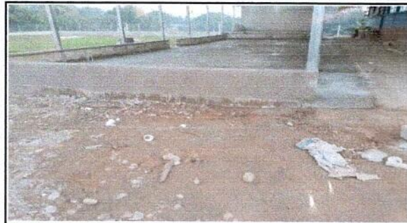
Foto 1: Vista frente a la escuela donde se finalizó la infraestructura ampliación de corredor y escenario.