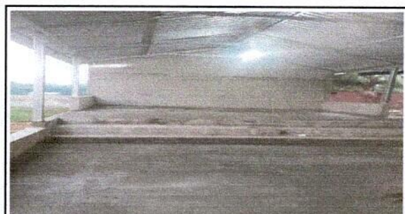
Foto 6: No habiendo mas que agregar se culmina el cuarto bloque nivel preprimario, ampliación de corredor y escenario con estructura metalica.

Observación: Si es necesario se pueden agregar hojas adicionales y actualizar el número de hojas.