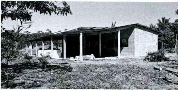
Foto1: Vista general del Establecimiento Educativo.