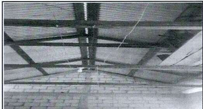
Foto 4: Sustitución de estructura de soporte de madera, por metal