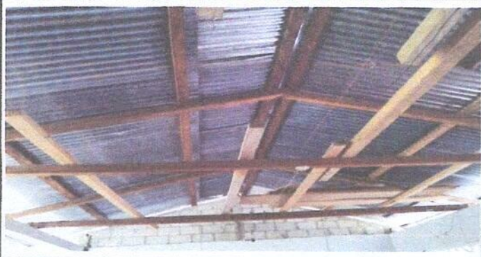
Foto 3: Sustitucion de Estructura de soporte de madera por metal.