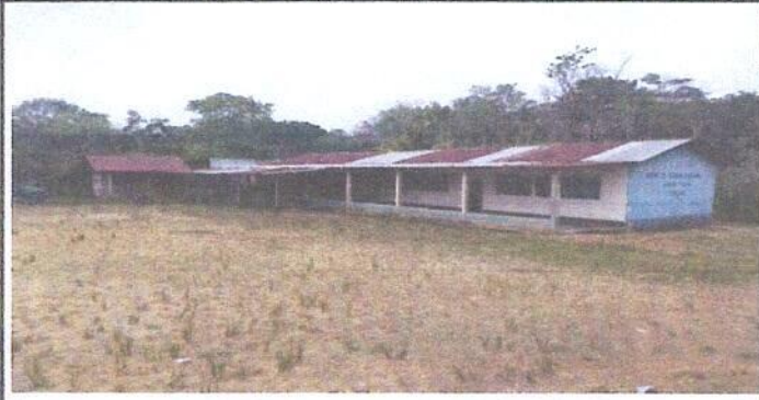
Foto 1: Sustitucion de lamina, por lamina troquela Aluzinc Calibre 26