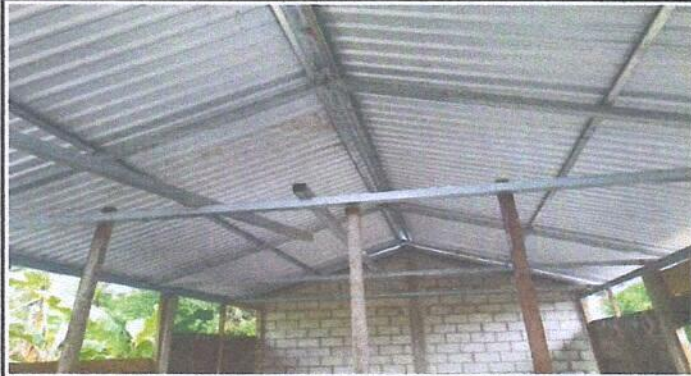
Foto 1: Vista general de la parte exterior del techado de la cocina del centro educativo, tomada del ángulo Este. (techado de la cocina finalizado)