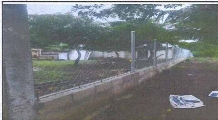
Foto 3: Vista externa del muro perimetral del centro educativo tomada del ángulo sur (muro perimetral finalizado)

Observación: Si es necesario se pueden agregar hojas adicionales, facturas, al número de hojas.