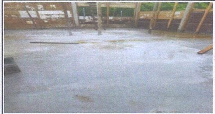
Foto 2: Vista frontal del piso de la cocina del centro educativo tomada del ángulo sur (torta de piso de la cocina finalizado)