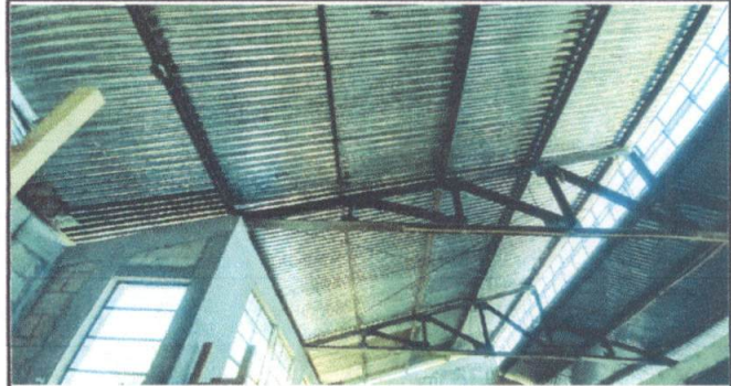
Foto 2: Mantenimiento a estructura de soporte de metal del módulo 1 o aula 1.