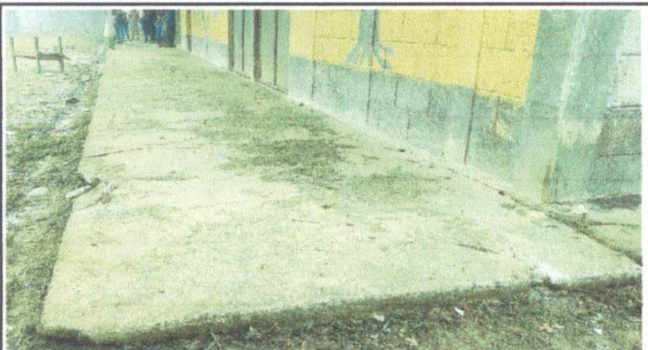
Foto 3: Sustitución de piso torta de concreto de corredor del módulo o aula 1..