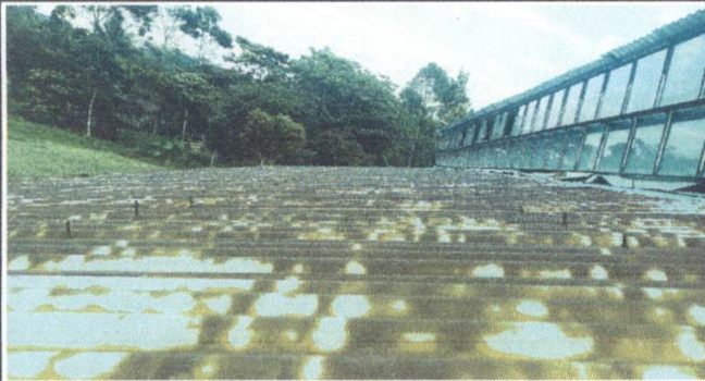
Foto1: Sustitución de todo el techo de láminas, por lámina troquelada aluzinc calibre 26 del módulo 1 o aula 1. (Desinstalación de las existentes e instalación de las nuevas láminas)