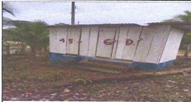
Foto 1 Sustitucion de lamina, por lamina troquelada Aluzinc calibre 26