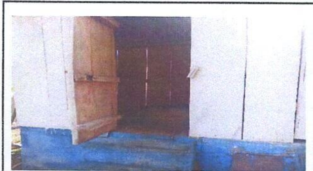
Foto 3 Sustitucion de puertas en servicios sanitarios