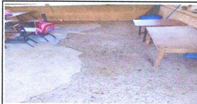
Foto 4 Reparacion de piso de torta de concreto