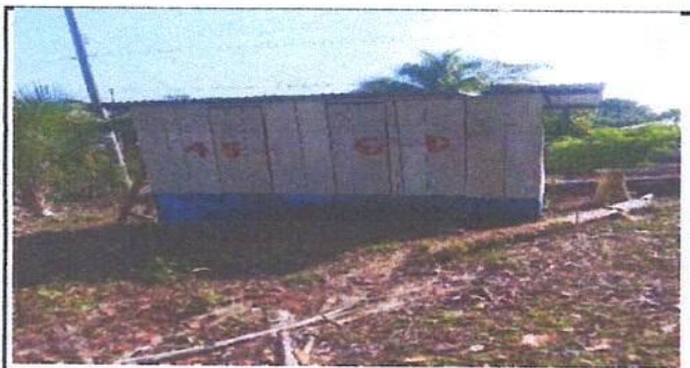
Foto 5 sustitucion de piso ceramico