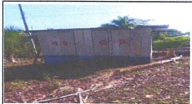
Foto 2 Sustitucion de estructura de soporte de madera por metal