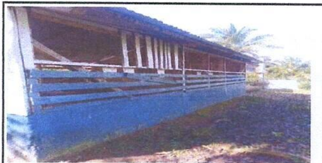
Foto 6 Repello en muro

Observación: Si es necesario se pueden agregar hojas adicionales y actualizando el número de hojas.