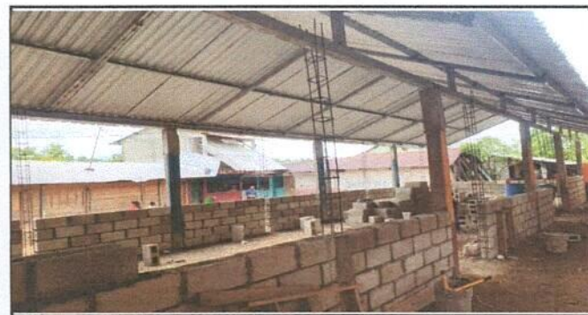
MODULO 2. Instalacion de lamina Troquelada Aluzinc calibre 26

Observación: Si es necesario se pueden agregar hojas adicionales y actualizar el número de hojas.