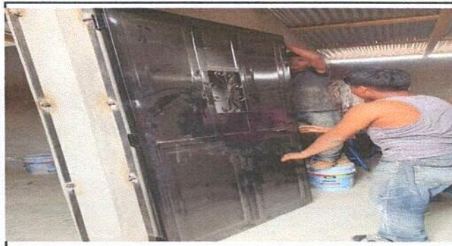
MODULO 1. Instalacion de Puertas de metal