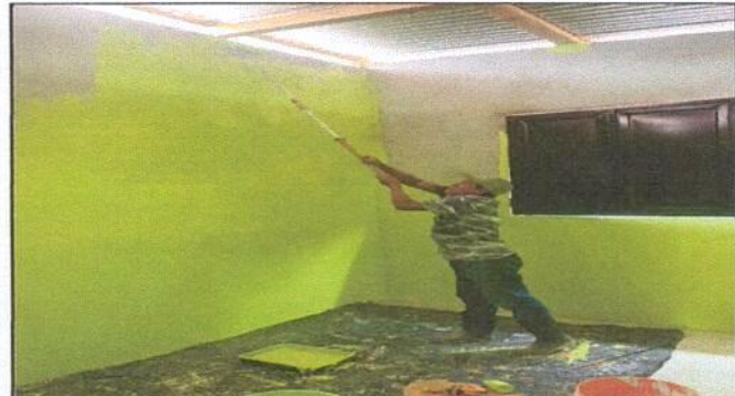
MODULO 1. Aplicación de pintura