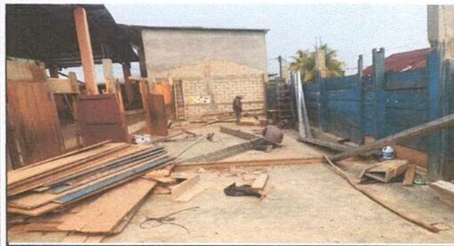
MODULO 2. Instalacion de estructura de soporte de metal