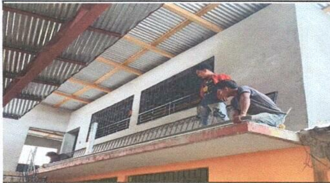
MODULO 1. Instalacion de Varanda de metal