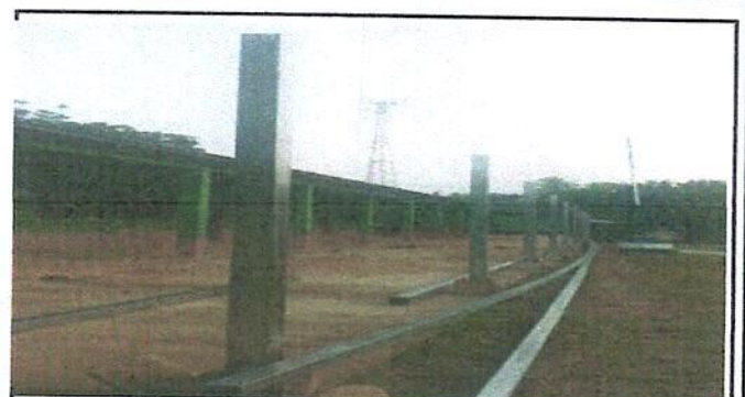
Foto 4: sustitucion de estructura de soporte de madera por metal.