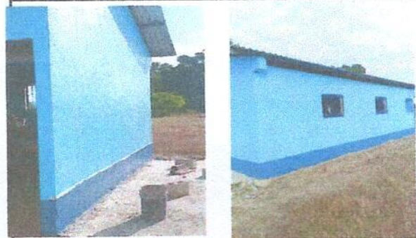
Foto 6: MODULO 4. REMOZAMIENTO: PINTURA EN MUROS INTERIORES Y EXTERIORES .

Observación: Si es necesario se pueden agregar hojas adicionales y actualizar el número de hojas.