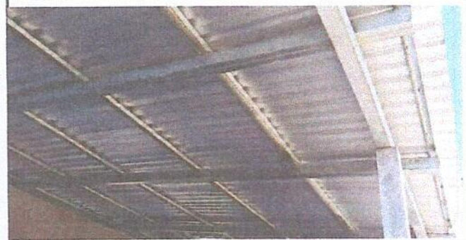
Foto 2: MÓDULO 1. REMOZAMIENTO: SUSTITUCIÓN DE ESTRUCTURA DE MADERA, POR METAL.