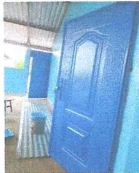
Foto 3: MÓDULO 2. REMOZAMIENTO: SUTITUCIÓN DE PUERTA DE MADERA POR METAL.