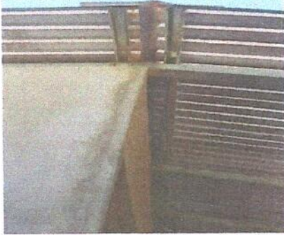
Foto1: MÓDULO 1. REMOZAMIENTO: SUTTICIÓN DE LÁMINA (MAL ESTADO) POR LÁMINA TROQUELADA.