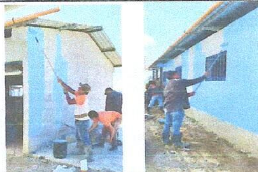
Foto 6: MODULO 4. REMOZAMIENTO: PINTURA EN MUROS INTERIORES Y EXTERIORES .

Observación: Si es necesario se pueden agregar hojas adicionales y actualizar el número de hojas.