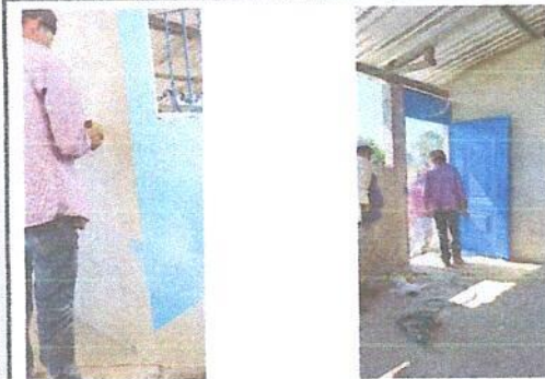
Foto 3: MÓDULO 2. REMOZAMIENTO: SUTITUCIÓN DE PUERTA DE MADERA POR METAL.