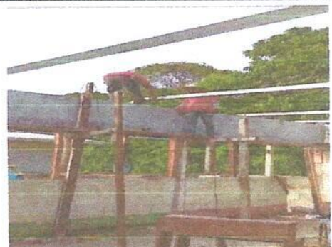
Foto 2: MÓDULO 1. REMOZAMIENTO: SUSTITUCIÓN DE ESTRUCTURA DE MADERA, POR METAL.