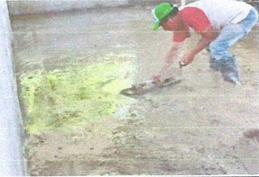
Foto 4: MODULO 2. REMOZAMIENTO: SUSTITUCIÓN DE PISO DE TORTA DE CEMENTO.