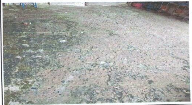
Foto 4: MODULO 2. REMOZAMIENTO: SUSTITUCIÓN DE PISO DE TORTA DE CEMENTO.