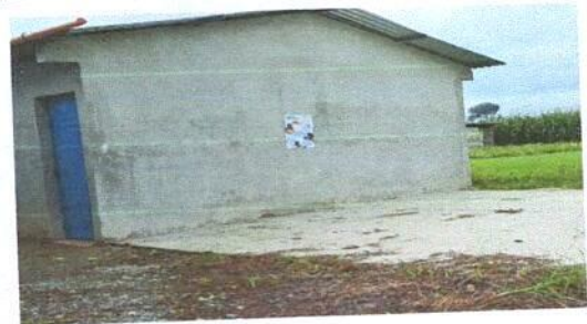
Foto 6: MODULO 4. REMOZAMIENTO: PINTURA EN MUROS INTERIORES Y EXTERIORES .

Observación: Si es necesario se pueden agregar hojas adicionales actualizadas. Número de hojas.