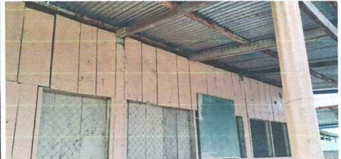
Foto 2: MÓDULO 1. REMOZAMIENTO: SUSTITUCIÓN DE ESTRUCTURA DE MADERA, POR METAL.