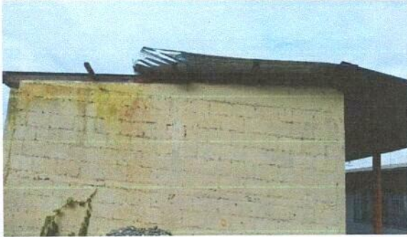
Foto 1: MÓDULO 1. REMOZAMIENTO: SUTITUCIÓN DE LÁMINA (MAL ESTADO) POR LÁMINA TROQUELADA.