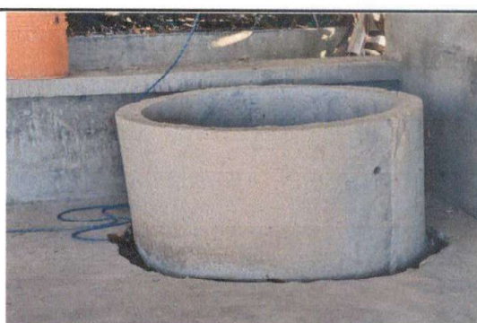
Foto 6: a)- Suministro de tubería PVC y llaves de chorro. b)- Suministro de depósito de agua y bomba de agua

Observación: Si es necesario se pueden agregar hojas adicionales y actualizar el número de hojas.