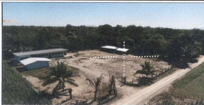
Foto1: Vista general del establecimiento.