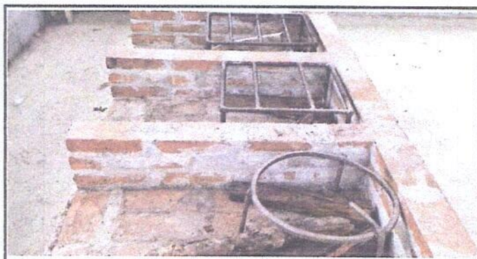
Foto 4: Sustitución de estufa rural completa, incluye chimenea y plancha de metal.