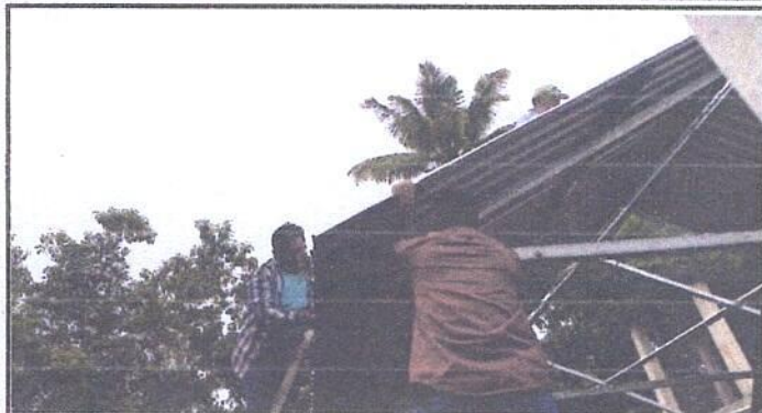
Foto 1: Sustitución de lámina, por lámina troquelada aluzinc calibre 26 de la cocina escolar