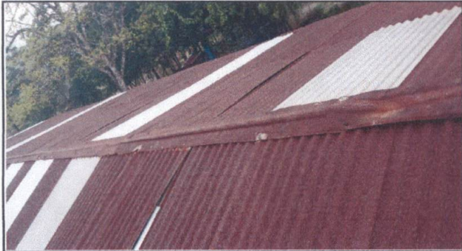
Foto1: Sustitución de Lámina por lámina troquelada del techo del edificio escolar.