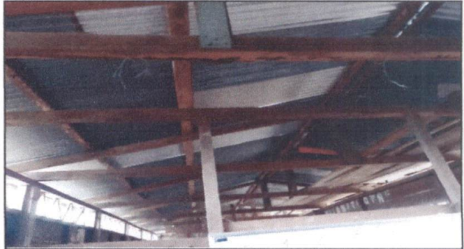
Foto 2: Sustitucion de estructura de soporte de madera por metal del edificio escolar.