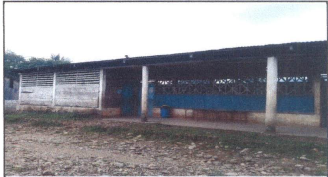
Foto 4: Mantenimiento de pintura en muros exteriores e interiores del edificio escolar.