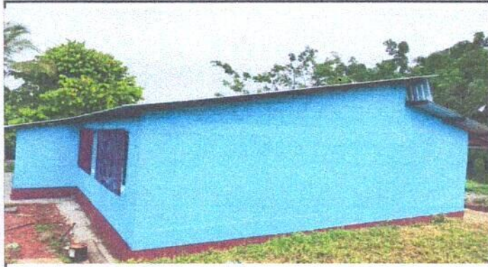
Foto1: Sustitución de cubierta de lámina del Centro Educativos