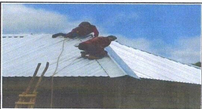
Foto 3: Vista externa del centro educativo, tomada del ángulo Oeste. (Techado)