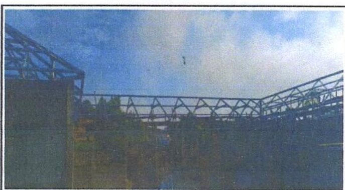
Foto 4: Vista general de la parte interna del centro educativo, tomada del ángulo Norte. (Estructura metálica)