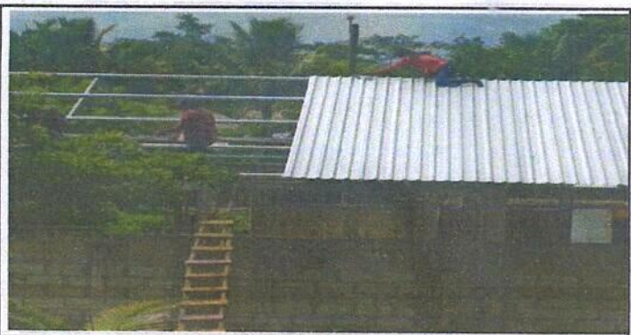
Foto 5: Vista externa del centro educativo, tomada del ángulo Este. (Techado)