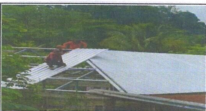
Foto 6: Vista lateral de la parte interna del centro educativo, tomada del ángulo Este. (Techado)

Observación: Si es necesario se pueden agregar hojas adicionales y actualizar el número de hojas.