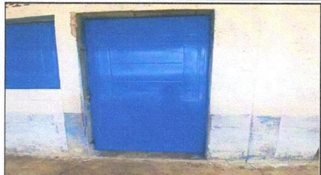
Foto 2: Sustitución de puerta de madera por metal del centro educativo.