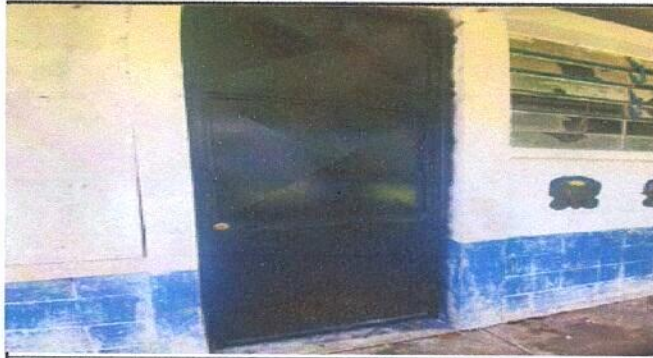
Foto 1: Mantenimiento a estructura de puerta (lijado, cepillado y pintura).