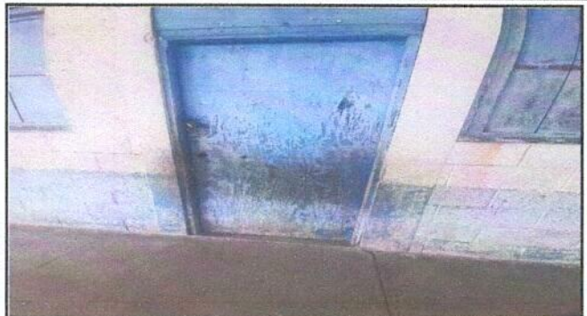
Foto 2: Sustitución de puerta de madera por metal del centro educativo.