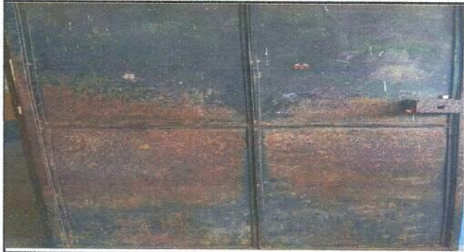
Foto 1: Mantenimiento a estructura de puerta (lijado, cepillado y pintura).