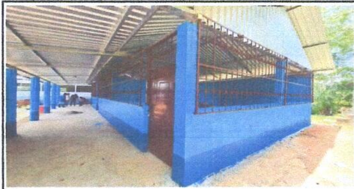
FOTO 3 ESTRUCTURA METALICA