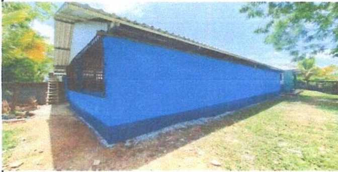
Foto1: CAMBIO MADERA A PARED DE BLOCK