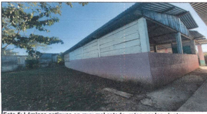
Foto 5: Láminas antiguas en muy mal estado, rotas por los vientos.