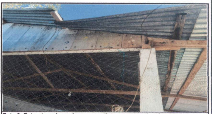
Foto 6: Estructura de madera muy antiguas que pueden desplomarse sobre los maestros y niños del centro educativo

Observación: Si es necesario se pueden agregar hojas adicionales, actualizar el número de hojas.