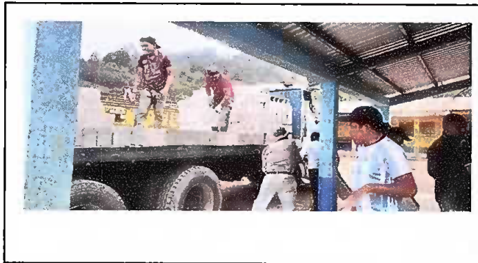
Foto1: Compra y descarga de materiales.